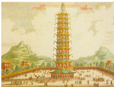
左图：古人绘制的大报恩寺塔 右图：武当山道家建筑上的马长翅膀，马嘴吐雾。

整座塔的窗户，全部用磨制得极薄的蚌壳进行封闭，叫作“明瓦”，玻璃引进中国之前，它是最好的建筑采光材料。在明清两代，每逢夜晚，约89米高的宝塔灯火通明，蚌壳作的明瓦散发出明亮光芒，宛若仙宫，人们无论在南京的哪个角度都可以看到。这极强的视觉效果，使人们时时意识到佛家文化的存在。