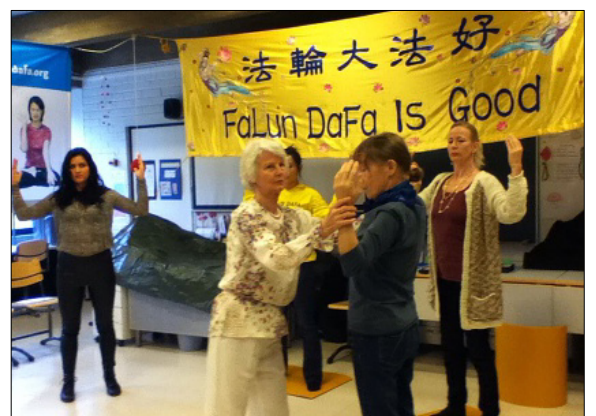
赫尔辛基精神健康博览会上，参观者学炼法轮功

◎经过五个多月的辩论和教委的讨论，加拿大多伦多公校教育局(TDSB)的教育委员们于 2014 年 10 月 29 日晚以 20 比 2 高票通过取消与中共孔子学院的合作计划。教育委员表示，坚决制止中共灌输和洗脑，“孔子学院是宣传共产党的，与孔子没关系。”