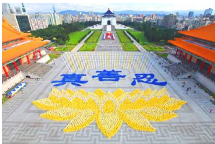
数千名台湾法轮功学员炼功排字：莲花映衬真善忍

载的仙界神花——优昙婆罗花在人间开放了，佛祖释迦牟尼在两千多年前讲到的婆罗花开，转轮圣王将在人间传法度人的预言来临。1992 年 5 月，法轮功创始人李洪志师父在中国长春市将被称为高德大法的法轮大法弘传于世。22 年过