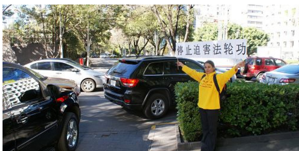
墨西哥法轮功学员在张德江入住的酒店外抗议

◎2014 年 11 月 25 日至 27 日，中共人大常委会委员长张德江访问墨西哥首都墨西哥城，他因在中国积极参与迫害法轮功，受到了