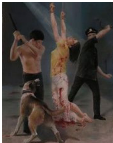
中共酷刑图示：鞭刑

2000 年 7 月 30 日，辽宁省葫芦岛市钢屯镇党委给保安队下了密令，在一个月内法轮功学员必须“转化”（放弃信仰）。同时，又换一批新的保安队员，而这些新面孔的