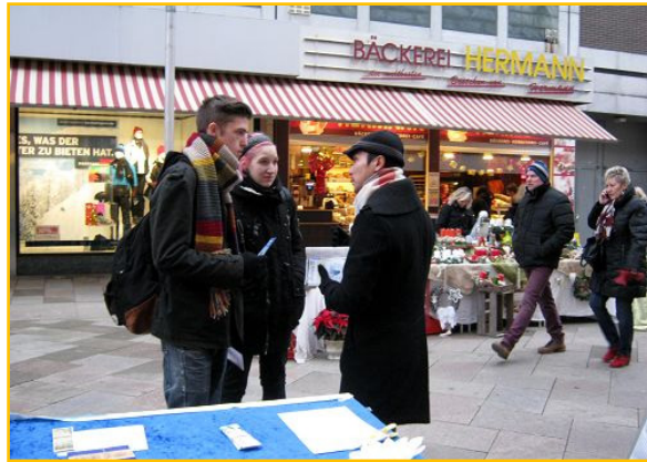
图：哥廷根民众和法轮功学员（右）交谈

因此这一天在和学员的谈话中，许多市民针对捐赠器官的分配是否公平、器官移植手术的弊端与“脑死”这一名词的定义