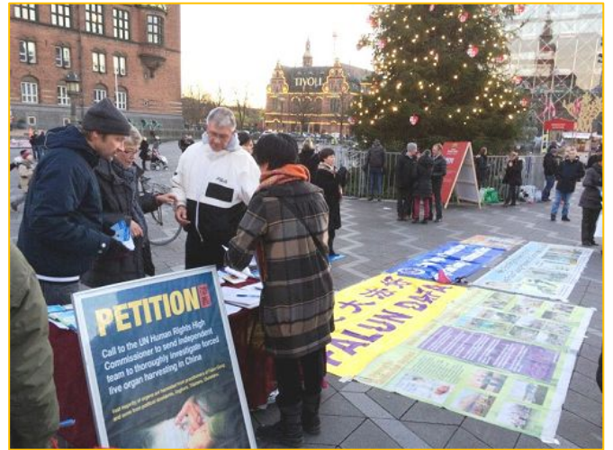
图:哥本哈根市政厅前,民众了解法轮功真相

一位来自英国的先生在市厅广场拍照。他在台湾学中文,并娶了台湾太太。他拍照完后走过来和法轮功学员交谈了二十多分钟。他对中国文化很感兴趣,也了解中共制度下糟糕的人权状况。他说:“我到过很多国家,看到这样的反迫害征签活动,都会签名支持。”他感慨地说:“你们在做世界上最有意义的事情,最值得做的事情。”