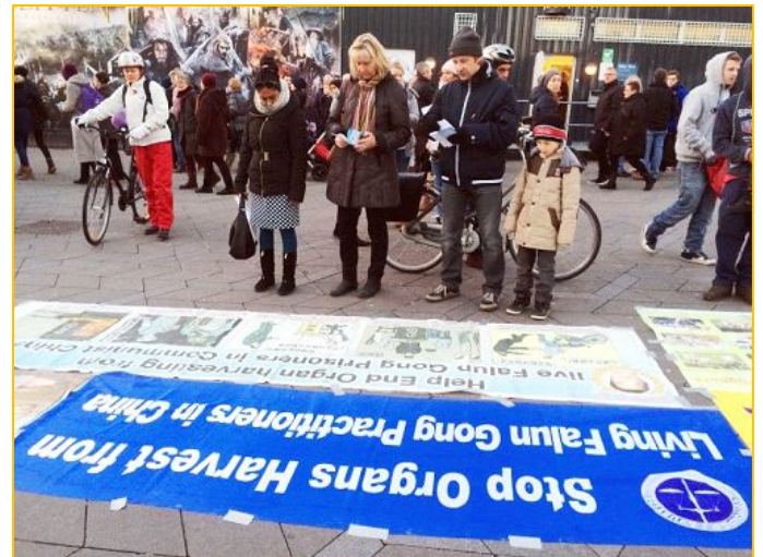
图:哥本哈根,寒风中民众支持法轮功反迫害

参加活动的法轮功学员表示:“天虽然很冷,看着街上很多购买圣诞节礼物的人,感慨万千。在中国对法轮功的迫害仍在继续,在西方国家还有很多人仍不了解真相,我们不管何时都在利用机会告诉人们真相。一年四季,不管什么气候、什么时间,即使是节日,我们都在做着我们应该做的,世人会感受到法轮大法的美好,大法中修炼人的无私,从而共同制止迫害。”◇