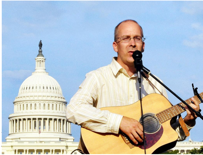
安德森在美国首都华盛顿国会山庄前

安德森·埃克森，一个地道的瑞典人，“Yellow Express”（黄色特快）乐团主唱，也是词曲创作人。安德森与他的同伴们几年间行走在欧洲大地，日内瓦、斯德歌尔摩、哥本哈根、柏林、慕尼黑、哥德堡等等各种音乐节和集会上都留下了他们的足迹。台上，安德森娴熟地拨动琴弦，歌声动人，很多观众由此听说了法轮功。