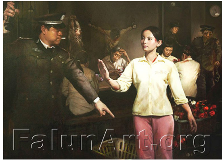
美丽的背後—监狱奴工产品(绘画)

当开庭即将结束时,两位律师就法院做出的不合理质证,及被告申请回避等合理诉求,被法院否决之事,和执法人员有不符合依法治国的原则,与法庭工作人员发生争辩时,法