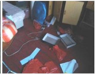
黄秀环家被抄现场