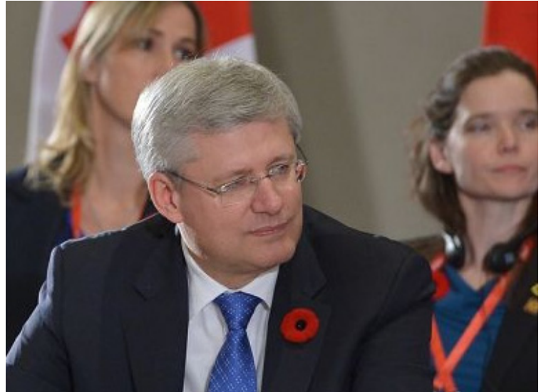
在中国北京参加 APEC 峰会期间, 加拿大总理哈珀向中共官员提出法轮功受迫害问题。图为哈珀在 APEC 会议上