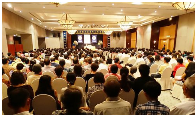
上：马来西亚法轮大法修炼心得交流会现场；

而周永康们的下场也是上天给那些执迷不悟、仍然在迫害法轮功的从犯们的慈悲警示，“你们停止迫害、立功赎罪的机会不多了！”◇