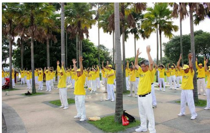
下：法轮功学员在公园广场前集体炼功