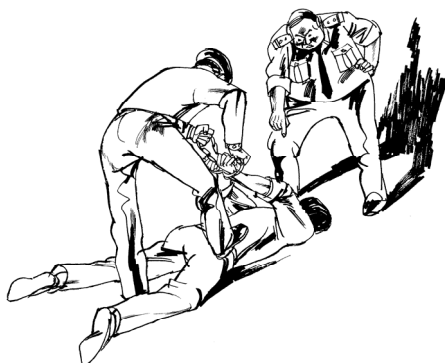
中共酷刑示意图：苏秦背剑：

把人的双手臂背在后面用手铐铐住，恶警抓住铁链踩住法轮功学员后背，用力往上拽，痛苦至极。