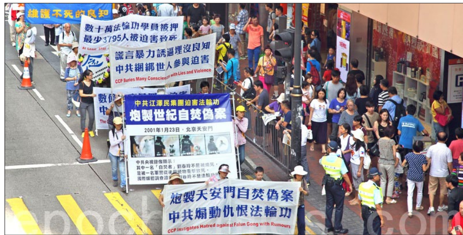
2014年10月，香港大游行中“江泽民集团炮制自焚伪案”等横幅令民众驻足。

江泽民、周永康、薄熙来一伙以为掌握着国家政权、控制着舆论和暴力工具，就可以无法无天，但他们没想到，上天在注视着一切，任何人都逃不脱善恶必报的天理。◇