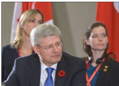
加拿大总理哈珀在访华期间

哈珀总理访华前，国会议员朱迪·斯格诺在国会声明：“总理去中国，国会山的法轮功修炼者请他提出强摘器官的问题，这一问题威胁到 10 位加拿大人的家庭成员。强摘器官的存在已经被独立证实了好几次。其中，一篇报道中引用中共网站上的明码标价——肾脏 6.2 万元，肝脏 13 万元，肺 17 万元。”◇