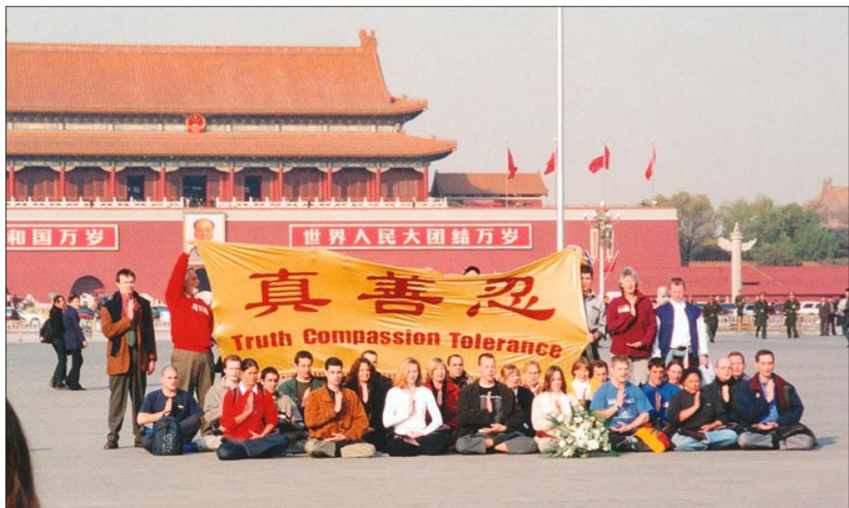
历史图片：2001年11月20日，西人法轮功学员在天安门广场。

我站在横幅的后面，我和几个人被警察最先塞进大巴警车里。‘这不是我们该呆的地方！’我跳到车外，还没跑几步，就被一个警察扑倒，我被推出去几米远。随后又扑上来几个警察，他们把我的双臂狠狠扭到了后背，使我剧痛……我们试图和警察沟通，他们不许我们开口。我们被押送到了警察局。”