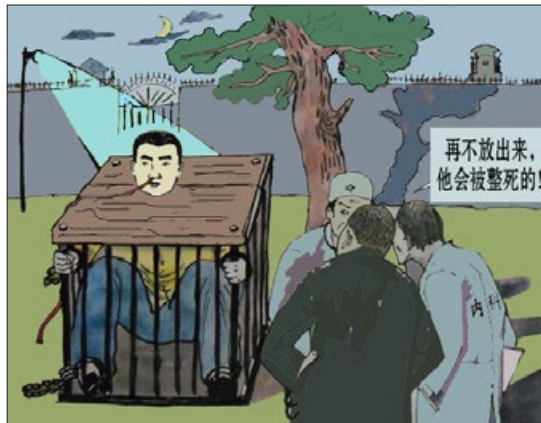
酷刑演示图：铐铁笼子

随后我被关在隔离室内的铁笼里（楼梯下面半地下式的铁笼，地面一踩就出水，紧邻阴沟，蚊子成堆），手被两副手铐吊在铁笼上面的钢筋上，脚被两副脚镣吊在铁笼另一头钢筋上，屁股着地，每日 24 小时，除吃饭和上厕所解开外，都这样铐着，前后数月。此后解除了脚镣，但手铐仍铐了数年。