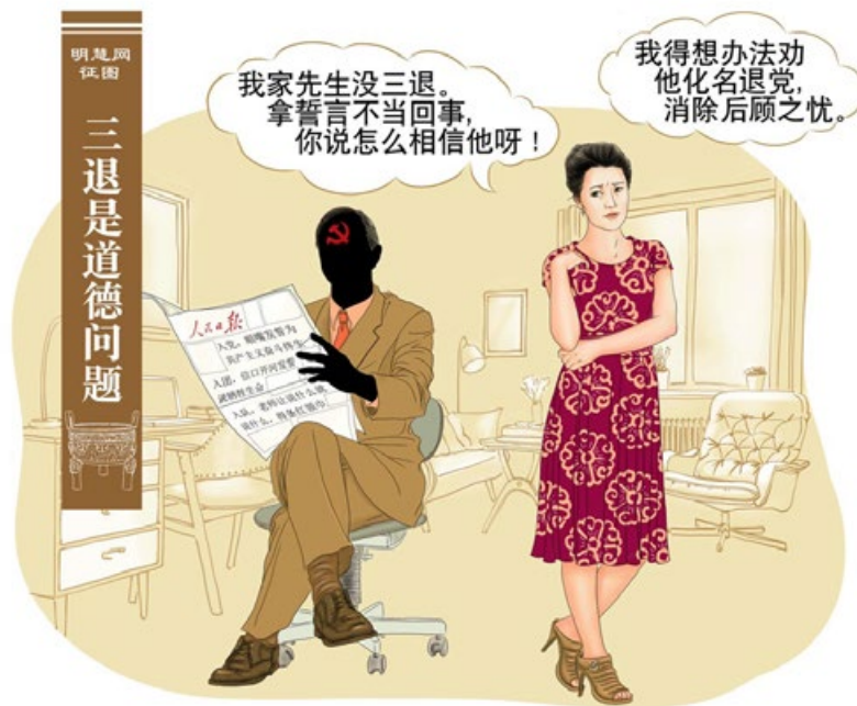
妻子：三退消除后顾之忧

这个故事对于普通的中国大陆民众在“退党、退团、退队保平安”等良言面前如何选择，也同样具有现实意义啊！（文／曾严）◇