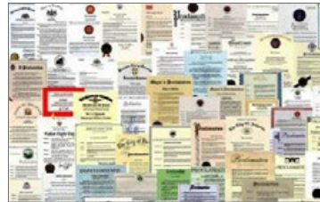
来自国际社会的褒奖（部分）

◎ 弘传世界 法轮大法已弘传到100多个国家和地区，受到世界人民的爱戴和尊敬。李洪志先生和法轮大法因对人类身心健康做出的杰出贡献，获各国政府褒奖、支持议案和信函3000多项。法轮功书籍被译成40种语言，在全球出版发行，并可在互联网上免费下载。◇