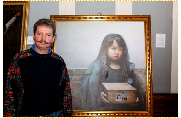
德国作家德特勒夫·阿尔斯巴赫和油画《孤儿泪》