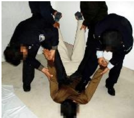
酷刑演示: 毒打 (“推”、“掰”、“撮”)