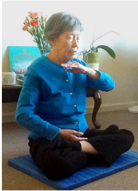
朱女士炼法轮功第五套功法