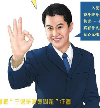
明慧网“三退是道德问题”征图