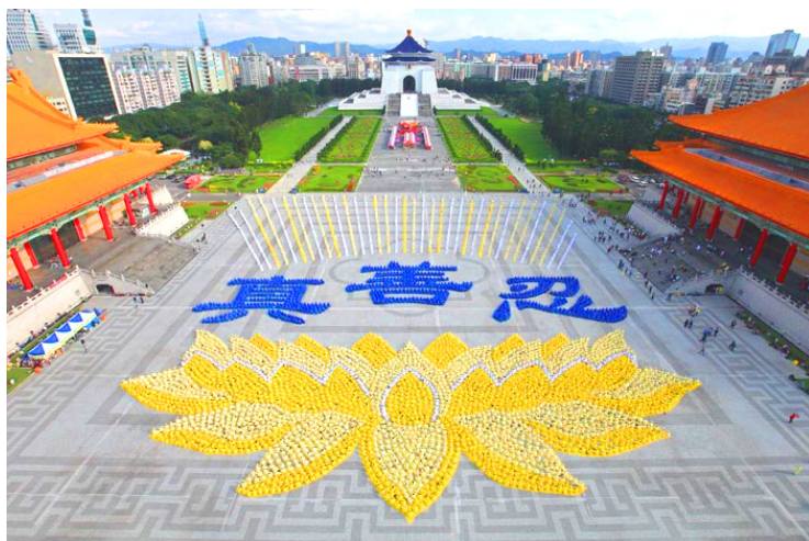
数千名台湾法轮功学员炼功排字：莲花映衬真善忍

载的仙界神花——优昙婆罗花在人间开放了，佛祖释迦牟尼在两千多年前讲到的婆罗花开，转轮圣王将在人间传法度人的预言来临。1992年5月，法轮功创始人李洪志师父在中国长春市将被称为高德大法的法轮大法弘传于世。22年过