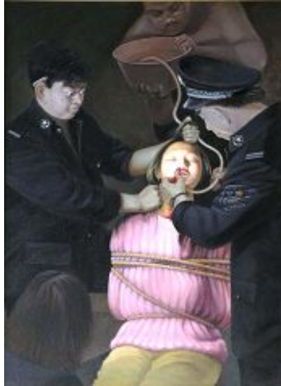
酷刑演示：野蛮灌食（绘画）

大、小便，需要两人架着拖着腿才能往前挪动，身体极度虚弱已到极限，生活已完全不能自理，身体内脏器官也已逐渐出现衰竭现象。