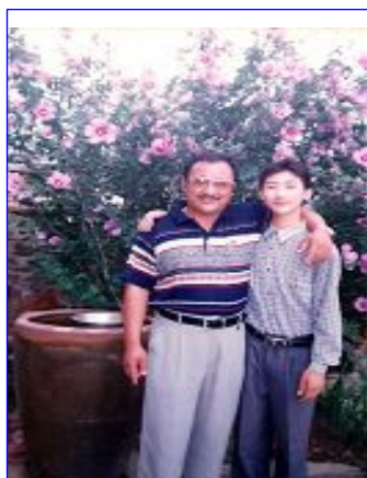
生前林宝山与儿子合影

10 万元奖金一花即光,可因此种下的恶果却要世代品尝,杀人、放火、打架、斗殴无人问津,按真善忍做好人却被迫害得家破人亡。事实再一次证明共产党的历史就是一部血腥的杀人史。乡亲们请你选择善良,制止迫害,让正义在中华大地永存!