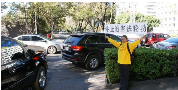
墨西哥法轮功学员在张德江入住的酒店外抗议

◎2014 年 11 月 25 日至 27 日,中共人大常委会委员长张德江访问墨西哥首都墨西哥城,他因在中国积极参与迫害法轮功,受到了