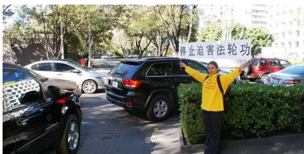
墨西哥法轮功学员在张德江入住的酒店外抗议

◎2014 年 11 月 25 日至 27 日,中共人大常委会委员长张德江访问墨西哥首都墨西哥城,他因在中国积极参与迫害法轮功,受到了