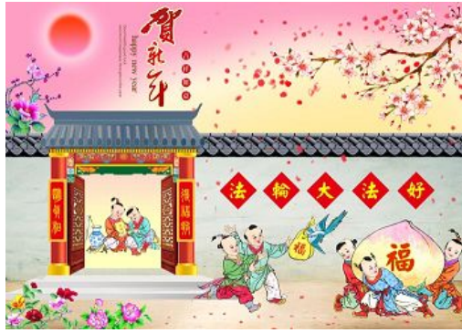
2014年明慧网年画作品

说在大陆已经差不多达到全覆盖了，有的已多次接到过真相资料了。相信不少人家都保存着一些，那么，你在给亲朋好友的礼物中可别忘了一样东西，给他们带上真相资料，大家传着看，交换着看，会对真相了解更全面，更明白。给他送点好吃的，那是口头福；送点好看的，那是饱眼福；送点好玩儿的，那也就是半个月的新奇，反正都是身外之物。可你如果送人真相，那可是救人命的。所以说，真相才是金不换的宝贝。咱们不能满足于一人明白，一家明白。有一个广告语说的好：“大家好，才是真的好！”