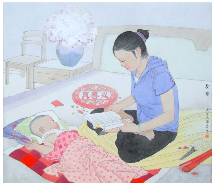
绘画《圣缘》 作者：大陆大法弟子

我笑了：十万元钱我都舍得了，一点利息又算得了什么呢？现在家庭矛盾解决了，钱也基本回到手了。丈夫也觉得两全其美，很高兴。（文／大陆大法弟子）◇