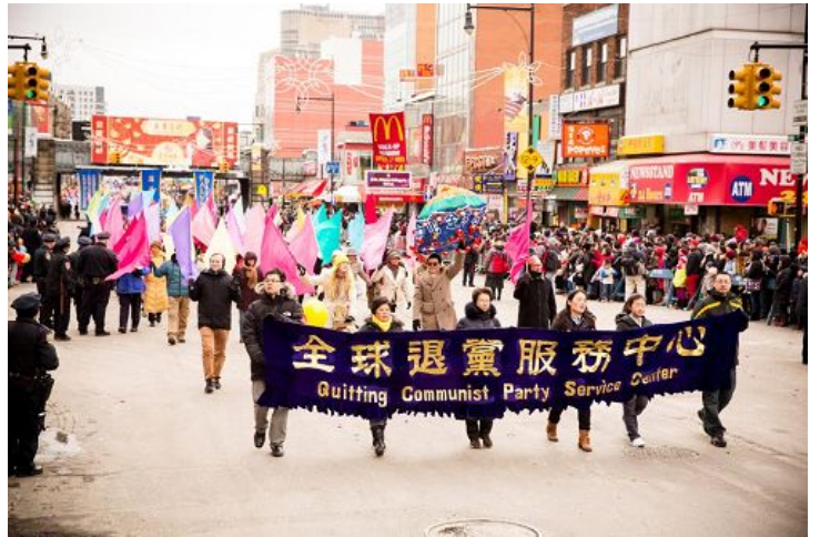
图：二零一四年二月八日，美国纽约法拉盛新年大游行队伍中，“全球退党服务中心”格外引人注目。“退党中心”向父老乡亲拜年，同时特别提醒大家“新年新气象，三退保平安”（退出中国共产党、共青团、少先队，简称“三退”）。