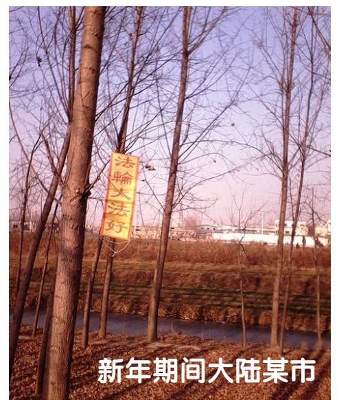
新年期间大陆某市