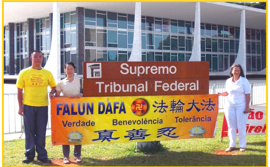
2014 年 2 月，巴西最高法院机构前的法轮功真相横幅。

巴西首都司法部的律师、法官们阅读真相资料后，对这场迫害感到震惊，无法理解中共的暴行。在科技开发部门口，一位保安负责人表示：敬仰神佛是人类正确的行为，绝不能被