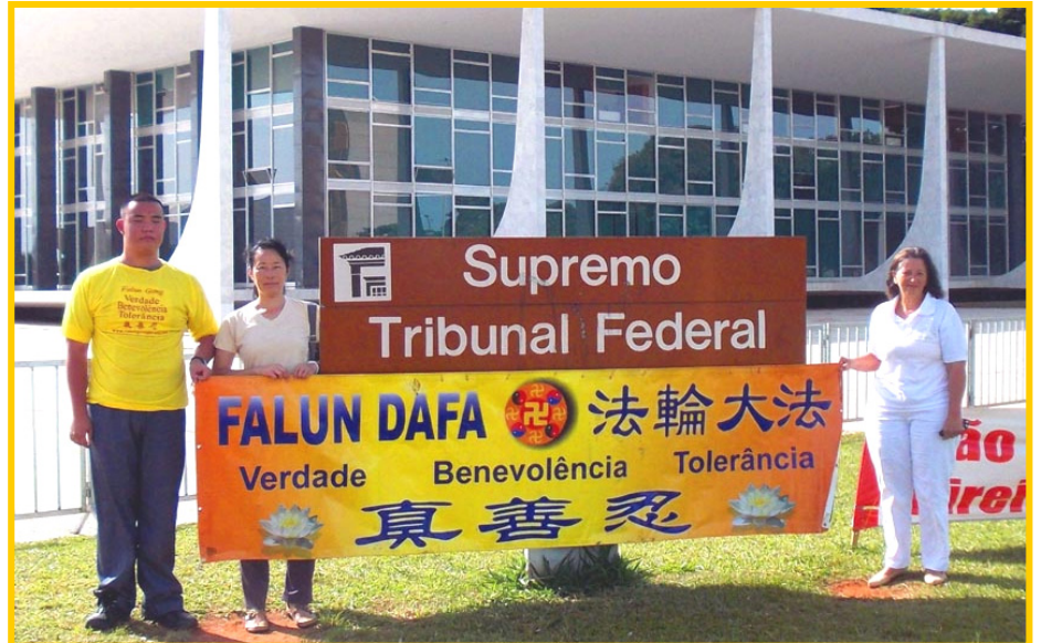
2014 年 2 月，巴西最高法院机构前的法轮功真相横幅。

巴西首都司法部的律师、法官们阅读真相资料后，对这场迫害感到震惊，无法理解中共的暴行。在科技开发部门口，一位保安负责人表示：敬仰神佛是人类正确的行为，绝不能被