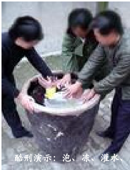
酷刑演示：泡、冻、灌水、

就是这样一个廉洁奉公、关心百姓疾苦、深受百姓爱戴的清官、好官，却屡遭中共长期迫害，被非法解除职务，停发工资，失去工作，二次被劫持到潍坊昌乐劳教所均被非法劳教3年。