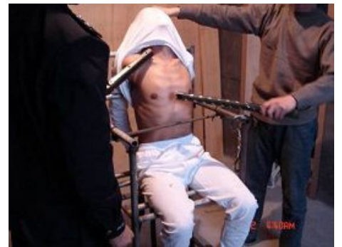
酷刑演示：电棍电击