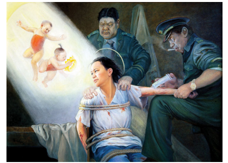
酷刑演示：打毒针（绘画）