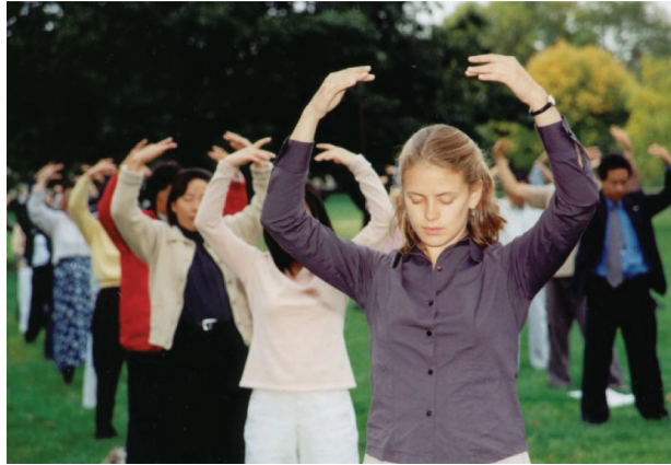
파룬따파의 아름다움은 일억에 달하는 사람들을 수련으로 이끌었다.

[밍후이왕 대륙투고] 우리 집에서 멀리 떨어진 곳에 살고 있는 조카가 폐암과 식도암으로 앓고 있다는 소식을 듣고 나는 병문안을 갔다. 그를 보는 순간 나는 깜짝 놀랐다. 70kg이던 그는 여위여 45kg 밖에 안 되었고, 화학약물 치료를 하느라 머리카락이 다 빠지고 없었다. 숨이 막혀 눕지도 앉지도 못하고, 1미터 높이로 쌓아 놓은 받침대에 무릎을 꿇고 엎드려 있었다. 그는 나를 보자 울면서 “숙모, 다 죽게 되었어요.....”라고 했다. 나는 “괜찮을 거야. 완쾌될 수 있어.”라고 말하고, 파룬따파(파룬궁)는 불가수련 대법이며, 병을 제거하고 몸을 건강히 하는 신기한 효과가 있는데 장쩌민이 질투로 파룬궁을 박해하고 있느냐 파룬따파는 이미 전 세계 100여 개 나라와 지역에 전파되었다는 것을 알려 주었다. 나는 그에게 소선대에서 탈퇴할 것을 권하고, ‘파룬따파하오(法輪大法好)’를 성심으로 외우고, 그의 부친과 아내도 시간이 있을 때마다 외우게 하라고 했다.