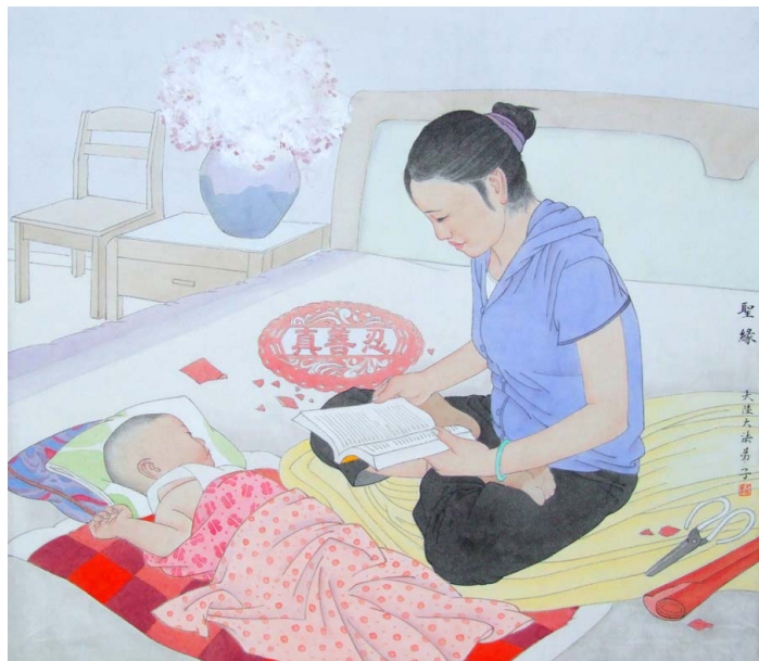
绘画《圣缘》 作者：大陆大法弟子

我笑了：十万元钱我都舍得了，一点利息又算得了什么呢？现在家庭矛盾解决了，钱也基本回到手了。丈夫也觉得两全其美，很高兴。（文／大陆大法弟子）◇