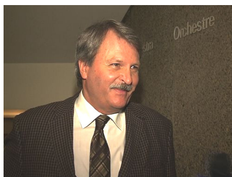
加拿大安省议员杰克·麦克莱伦

些组织到我的办公室，来影响我的观点和我对法轮功的支持。他们是非常非常错误的。我今后要更为有力地法轮功发声。我支持法轮功团体和他们