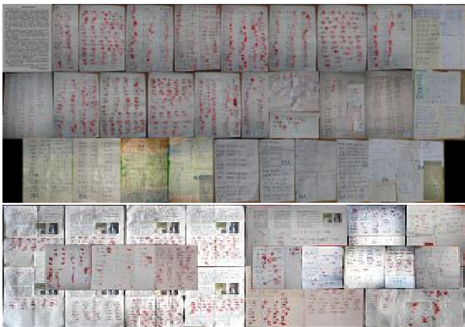
上图：两批共 2300 联名营救周向阳

当向阳再次被投入监狱，面对来自警方的威胁，珊珊仍坚持申诉，并写下公开信《七年等待 九年冤狱》，信尾写道：“我是在为我丈夫伸冤，其实这也是捍卫信仰的权利、捍卫法律的正义，法轮功被迫害十二年了，我为丈夫伸冤也八年了。我依然怀着一个梦想，在我们的国度里，所有象我们夫妻一样的家庭都能过上稳定平静的生活。不会因为说真话遭陷害，不会因为坚持信仰被抓捕，让真