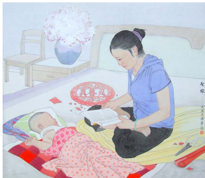
绘画《圣缘》 作者：大陆大法弟子

我笑了：十万元钱我都舍得了，一点利息又算得了什么呢？现在家庭矛盾解决了，钱也基本回到手了。丈夫也觉得两全其美，很高兴。（文／大陆大法弟子）◇