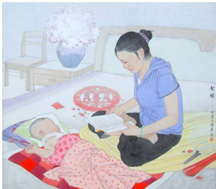
绘画《圣缘》 作者：大陆大法弟子

我笑了：十万元钱我都舍得了，一点利息又算得了什么呢？现在家庭矛盾解决了，钱也基本回到手了。丈夫也觉得两全其美，很高兴。（文／大陆大法弟子）◇