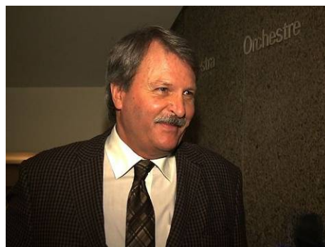
加拿大安省议员杰克·麦克莱伦

些组织到我的办公室，来影响我的观点和我对法轮功的支持。他们是非常非常错误的。我今后要更有力地为法轮功发声。我支持法轮功团体和他们