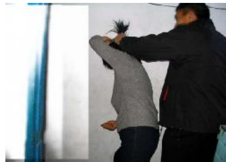
酷刑演示：揪头发撞墙

璃，但透明，来往的狱警和犯人都能看到），以此来羞辱学员，反而诬蔑法轮功学员不要脸。