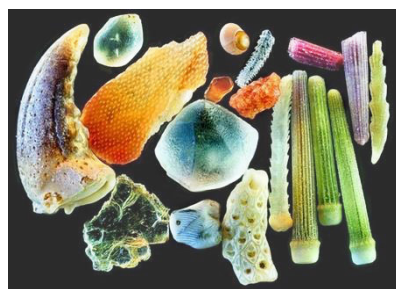
显微镜中,250倍放大率下的沙子。在远超人类视觉分辨率极限的情况下,这些细小的微粒呈现出精细的结构和绚丽的光彩。