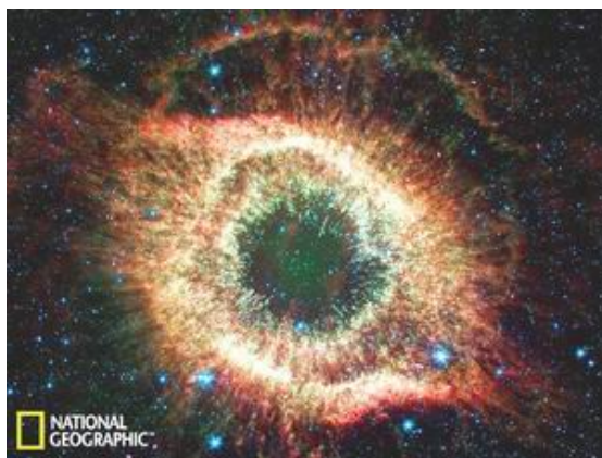
650 光年外螺旋星云似“苍穹之眼”(美国宇航局斯皮策空间望远镜观测)