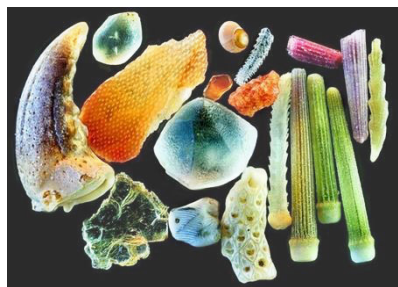
显微镜中，250 倍放大率下的沙子。在远超人类视觉分辨率极限的情况下，这些细小的微粒呈现出精细的结构和绚丽的光彩。