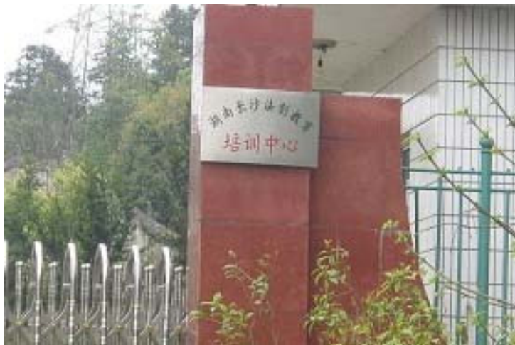
捞刀河洗脑班的大门