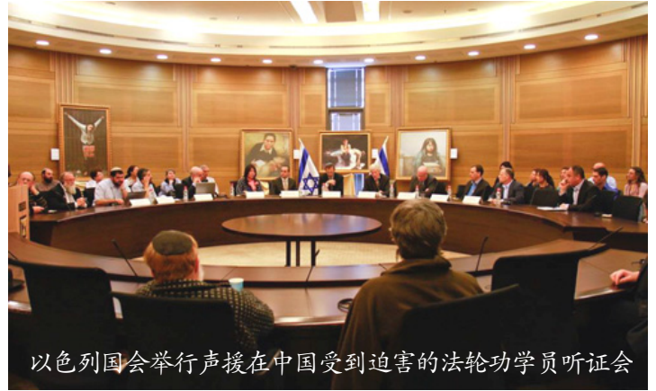
以色列国会举行声援在中国受到迫害的法轮功学员听证会

近两周以来，以色列社会十余家主流媒体连续报道法轮功受迫害和中共强摘法轮功学员器官的相关话题。