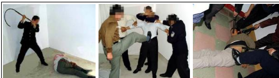
酷刑演示：抽打、毒打、多根电棍电击

有一次，七、八个人用没刨光的黄花松板子打一个年轻的法轮功学员，该学员被抬回来后，后背肿起老高，后背全是刺，几个人帮助他拔刺。