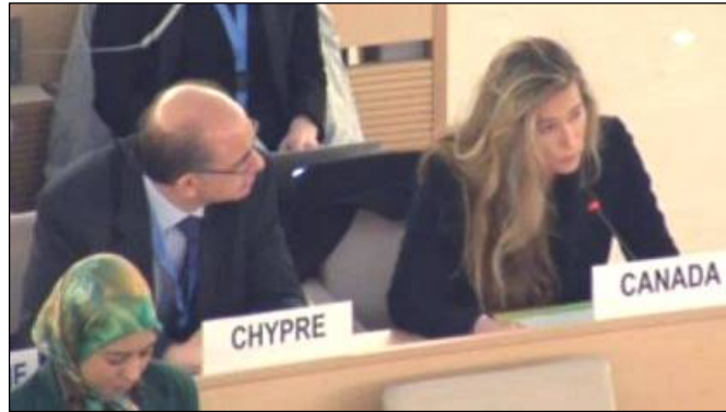
联合国人权委员会加拿大代表罗里女士(右)表示,继续关注中国法轮功学员受迫害情况及活摘器官问题。

大会上,中共官员的说辞再次自相矛盾。与以往一样,中共官员拒绝承认强摘器官。但在移植器官的来源上,中共说辞始终前后矛盾,据香港《明报》3月12日报导,中共前卫生部副部长黄洁夫近日证实,截至目前,大陆仍有死囚在自己及家属不知道的情况下“捐献”器官,并首次披露,死囚器官的“捐献”都是医生