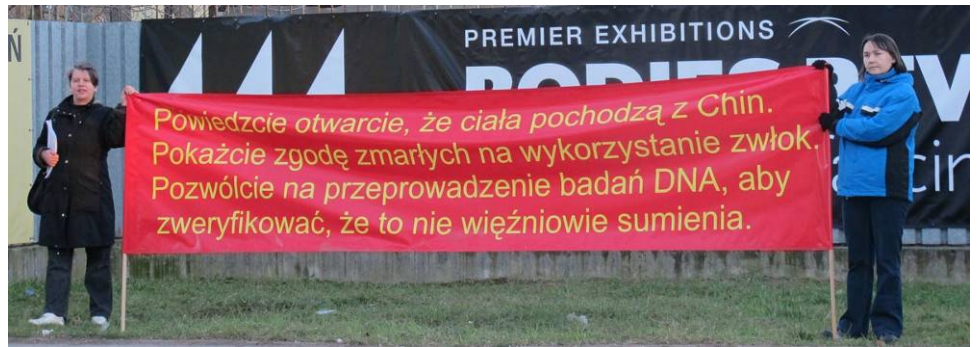
波兰法轮功学员在华沙化工研究所门前，手持横幅要求澄清尸展真相

报道说：这些文件应该保存在美国总部。但经查证发现，美国第一展览公司网页上有如下声明：这些中国公民或居民的原始身体遗骸都来源于中国警方，中国警方有可能从监狱中获取这些尸体。但是（美国）第一展览公司不能独立确认展览中的哪