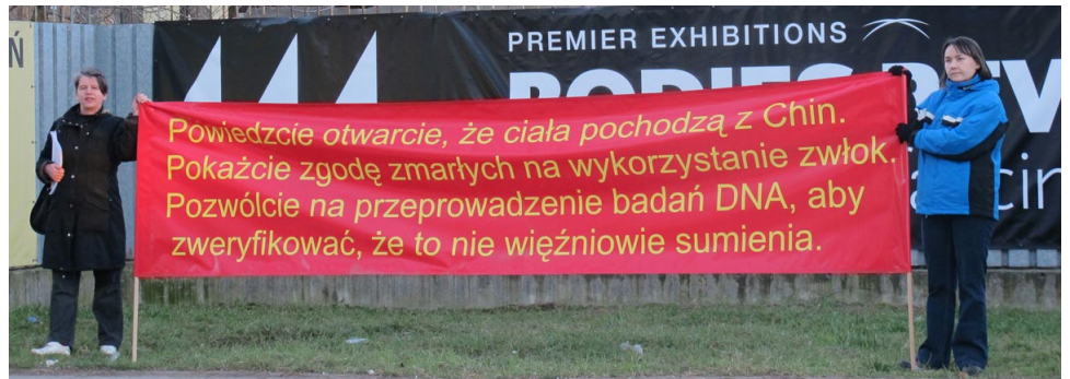
波兰法轮功学员在华沙化工研究所门前，手持横幅要求澄清尸展真相

报道说：这些文件应该保存在美国总部。但经查证发现，美国第一展览公司网页上有如下声明：这些中国公民或居民的原始身体遗骸都来源于中国警方，中国警方有可能从监狱中获取这些尸体。但是（美国）第一展览公司不能独立确认展览中的哪