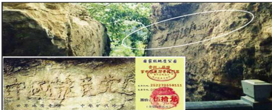
图：二零零二年六月，在贵州平塘县掌布乡发现二亿七千万年前的巨石，在500年前崩裂的断面内惊现六个排列整齐的大字“中国共产党亡”，经三批专家鉴定字为天然形成，其照片（上面小图）印在风景区的门票上。

中共说不定哪一天说解体就解体了，正如乌克兰剧变一样。一旦中共解体，你就没有“三退”的机会了，到那时，你曾经发誓把自己的一生交给邪党的誓约如何兑现？难道你愿意跟着中共恶党一起被清算吗？如果你不愿意成为中共的陪葬，那就尽快“三退”吧，时机真的不多了。◇