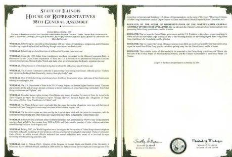
伊州众议院通过的 HR0730 号议案

鉴于，据美国国务院、美国国际宗教信仰自由委员会、国际特赦组织、人权观察，以及其它政府及第三方组织