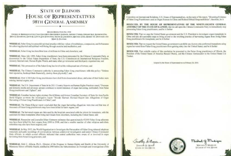
伊州众议院通过的 HR0730 号议案

鉴于，据美国国务院、美国国际宗教信仰自由委员会、国际特赦组织、人权观察，以及其它政府及第三方组织