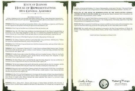
伊州众议院通过的 HR0730 号议案

鉴于，据美国国务院、美国国际宗教信仰自由委员会、国际特赦组织、人权观察，以及其它政府及第三方组织