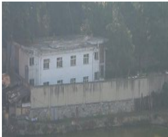
秘密关押法轮功学员的 3 号楼

烂泥沟洗脑班采取各种灭绝人性的手段“转化”法轮功学员，如谋杀、酷刑、把破坏大脑神经的药物偷偷放进法轮功修炼者喝的水里、威胁强奸；三个包夹人员与一个法轮功学员同住一个单间，每天 24 小时寸步不离，逼迫写所谓的保证，天天逼迫看